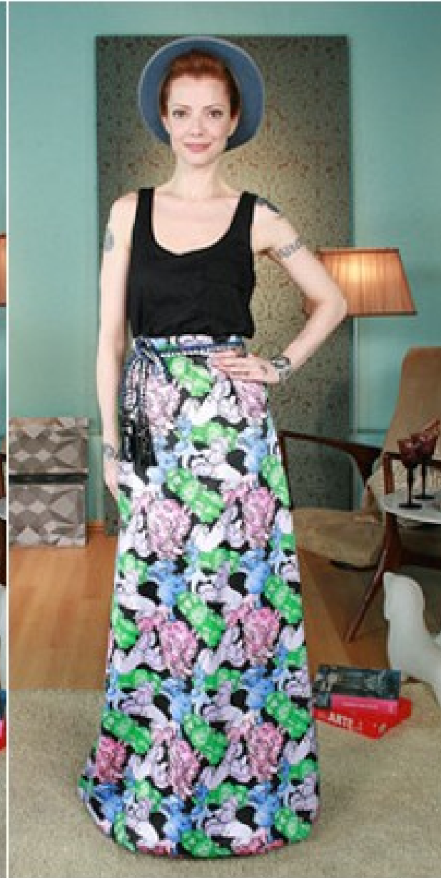
Look da esquerda: Saia Triton, tricot Animale, cinto Fit, sapato ShoeStock, pulseira Guerreiro, bolsa Constança Bastos / Look do meio: saia Têca, casaco Colcci, regata Hering, sapato ShoeStock, bolsa Zeferino, colares Guerreiro / Look da direita: saia Reinaldo Lourenço, sapato Fernando Pires, regata TNG, cinto Santa Ephigênia, pulseira Guerreiro, anel Carla Amorim, chapéu UVLine