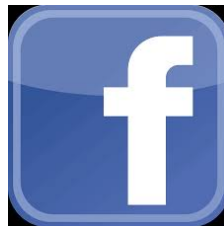
Figura 4.1: Facebook, a rede social com maiores usuários no mundo.

Atualmente a rede social mais utilizada é o Facebook. O Facebook foi criado por Mark Zuckerberg em fevereiro de 2004, e desde então vem atraindo seguidores e mais seguidores a cada ano que passa.