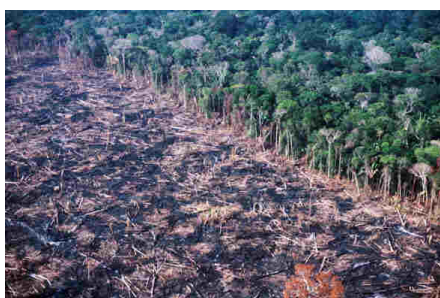
Figura 3.1: Desmatamento na Amazônia vem crescendo ao longo dos anos, muito pelo fato da exploração de madeira.

A floresta amazônica ocupa uma área de 5.500.000 \text{ km}^2 , como sabemos ela é a maior floresta tropical do mundo. Um dos grandes problemas que afetam a Amazônia atualmente é o desmatamento.