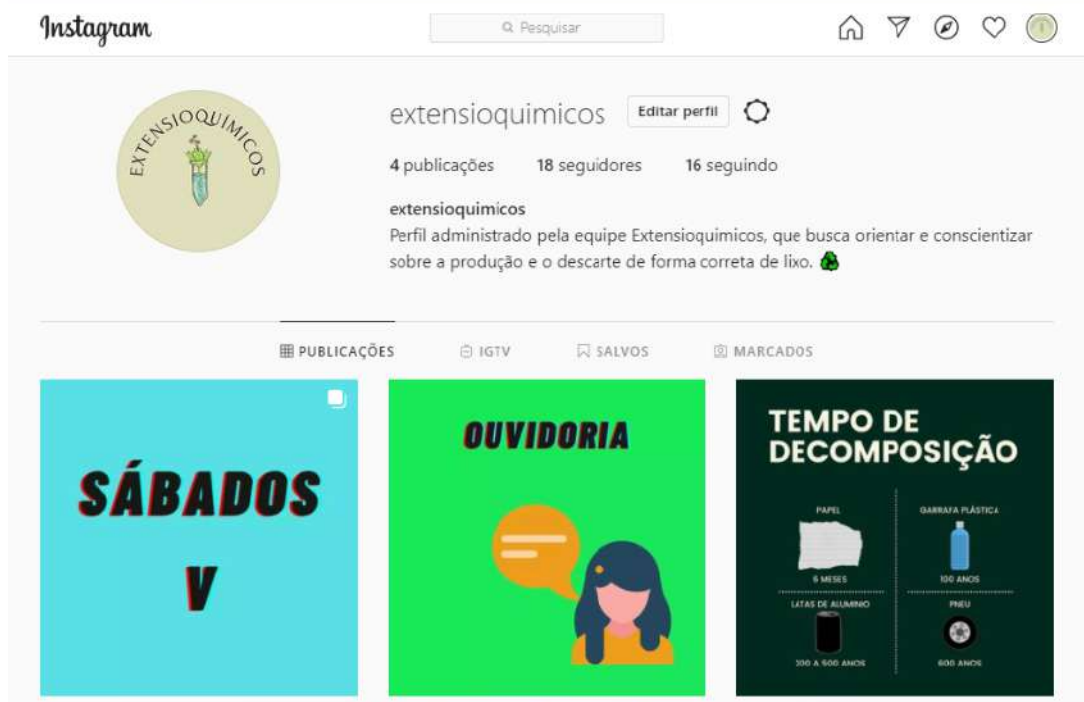
Figura 1: Página do Instagram Extensioquímicos